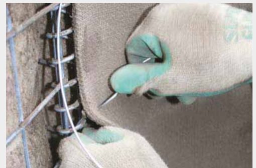
Tel ile Sabitleme

Kumaş ekipman gerektirmeden fabrikada hazırlanmış spiral bağlantılar kullanılarak kum sepetlerine hızlıca sabitlenebilir.